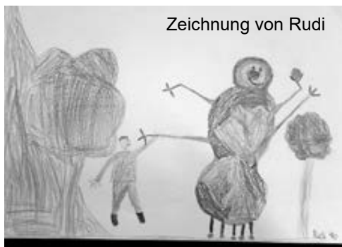
Zeichnung von Rudi

Am 10.01.2022 unternahmen die Klassen 4a und 4b der Hans-Memling-Grundschule einen Ausflug.